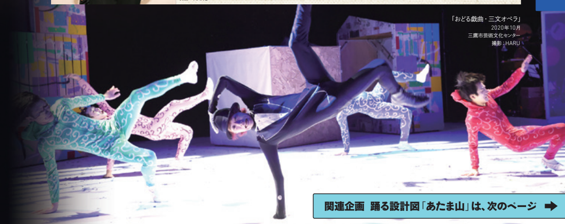
「おどる戯曲・三文オペラ」 2020年10月 三鷹市芸術文化センター