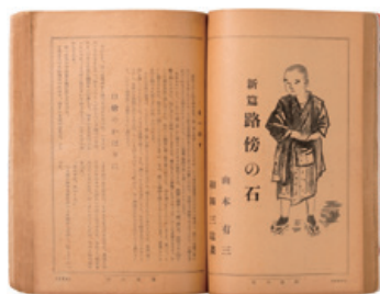
雑誌「主婦の友」(第22巻第11号) 昭和13年11月

自筆原稿や、連載当時の朝日新聞、映画ポスターなどの多彩な資料とともに、人々を惹きつける「路傍の石」の普遍的な魅力を、少年・吾一の姿に焦点を当てながらご紹介します。「路傍の石」が執筆された洋館で、本展をお楽しみいただければ幸いです。