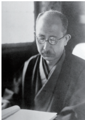
「路傍の石」執筆の頃の山本有三 昭和13年頃 / 応接間にて