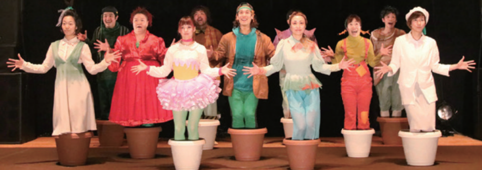
「ERROR ～おどる小説4～」 2018年4月 / 三鷹市芸術文化センター