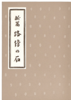
『新篇 路傍の石』新潮社 / 昭和16年8月