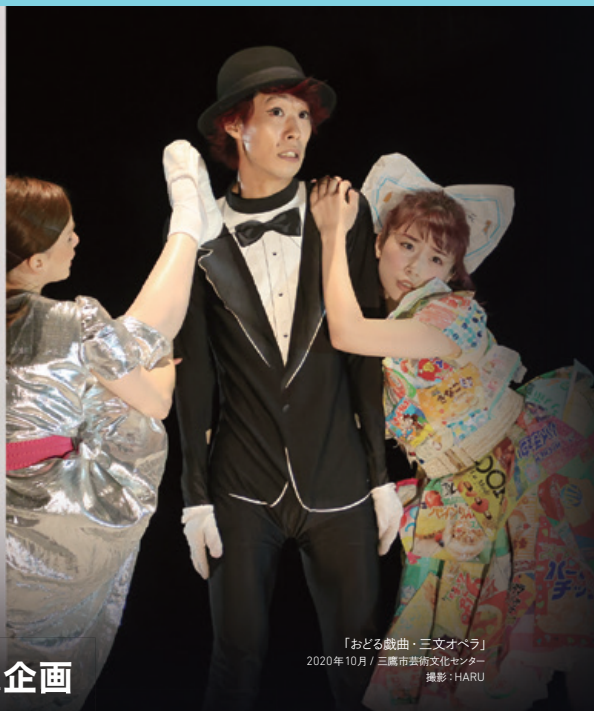
「おどる戯曲・三文オペラ」 2020年10月 / 三鷹市芸術文化センター