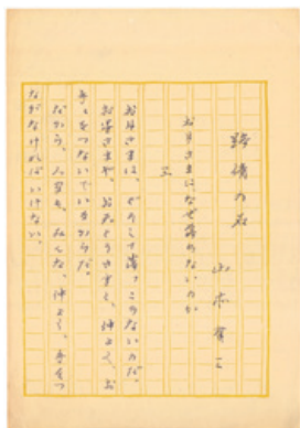
原稿「お月さまは、なぜ落ちないのか 三」