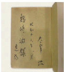
鱒崎潤への署名本『新ハムレット』 昭和16年7月 / 文藝春秋社 (三鷹市新収蔵資料)