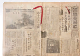
山本有三の寄附を報じる「駿台新報」 昭和10年1月1日