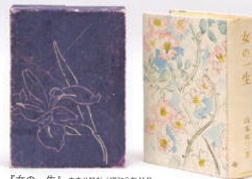
『女の一生』 中央公論社 / 昭和8年11月