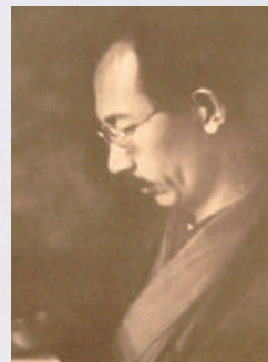
山本有三 昭和6年頃 / 出典：近代日本人の肖像

文科学士の卒業製作を収録した昭和10年発行の選集や、有三の在職中に刊行された『女の一生』の初版本など、多彩な資料とともに、作家および教育者・山本有三の活躍をご覧ください。