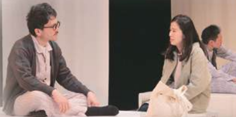
『病室』 2021年7月 / 三鷹市芸術文化センター 星のホール

HP: http://gekidan-futsu.com X (@Twitter): @gekidan_futsu