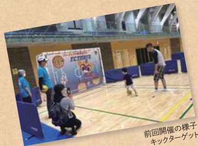
前回開催の様子 キックターゲット

サポートが必要な方もご安心ください。スポーツフェスティバルを満喫していただくための「サポートデスク」を設置しております。参加しやすいブースなどご案内できますので、ぜひ奮ってご参加ください。