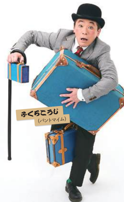
ふくろうじ (バントマイム)