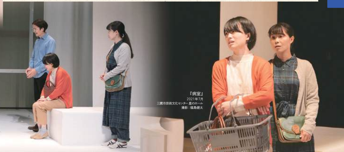
『病室』 2021年7月 三鷹市芸術文化センター 星のホール

2019年の初演から、2021年の再演を経て、再び星のホールで『病室』を上演できることを大変嬉しく思っております。『病室』は劇団普通が近年上演しております全編茨城弁芝居のきっかけとなった作品で、言葉では言い尽くせない特別な思い入れのある作品です。まるで仲の良かった時も悪かった時も人生を共にした友人のような家族のような存在で、大切に思うと同時に思い出す胸の苦しくなるような思いがすることもあります。初演は5年前ですが、構想はそれより遥か昔、私が役者を始めたばかりの頃からあり、長い付き合いなのです。その『病室』とまた正面から向かい合う時が来ました。ですがまだ今は、心静かに隣に並んで座って顔も見ずにお互い話をしているような状態です。12月の上演の時、皆様に『病室』と私がどう向き合ってきたかを、是非ご覧いただけますと幸いです。