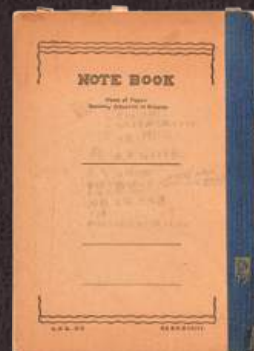
創作ノート (年代不詳)