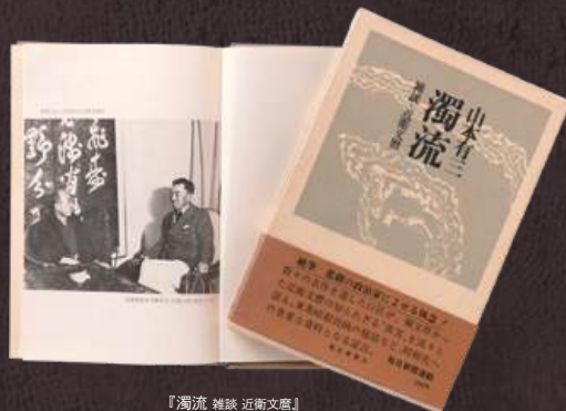
『濁流 雑談 近衛文麿』 (毎日新聞社 / 昭和49年5月)