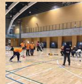
ポッチャみたかカップの様子

問合せ ●SUBARU 総合スポーツセンター Tel: 0422-45-1113 ●三鷹市スポーツと文化部スポーツ推進課 Tel: 0422-29-9863