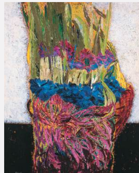
《花》 162×130cm / 1975年 / 山形美術館蔵