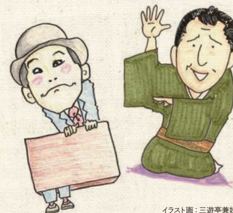
イラスト画：三遊亭兼好

ふくろうじさんの、私は大ファンである。度々 ゲストをお願いしているが、あきることがない。 楽屋で話をしても話題が豊富で楽しい。 落ち着いたいい声である。その声をお客様方 にお聴かせできないのが残念である。