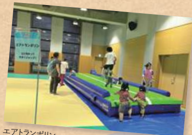
エアトランポリン