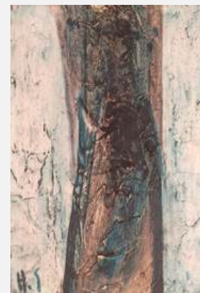
《青い樹(仮題)》 39×32cm / 年代不詳 / 三鷹市蔵

三鷹市の所蔵品からは小品ですがとても珍しい青い樹を、そして故郷の山形美術館からは代表作である「樹」を3点、そしてそれに続く鮮やかな色彩が特徴の3点、計7点を展示致します。どれだけ凝視してもし尽くすことのない作品たちです。どうぞ、心ゆくまでご鑑賞ください。