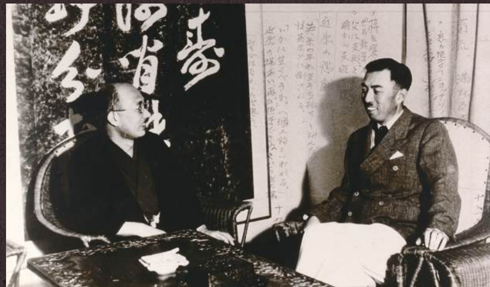
山本有三と近衛文麿(昭和14年8月 / 軽井沢の近衛文麿別荘にて) *背景使用画像:「創作ノート」(年代不詳)

また、会期中には、文豪転生シミュレーションゲーム「文豪とアルケミスト」(DMM GAMES)とのタイアップ企画として、山本有三ゆかりの深い三鷹市山本有三記念館・栃木市立文学館・山本有三ふるさと記念館の三館連携スタンプラリーを開催します。期間中、三鷹市山本有三記念館と栃木市立文学館でスタンプを押した方に、デザインの異なるポストカードをプレゼント! 3館すべてのスタンプを集めた方には、最後にスタンプを押した館で、描き起こイラスト入りの特典カードをプレゼントいたします。