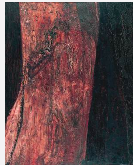
《樹 (一)》 162×130cm / 1961年 / 山形美術館蔵